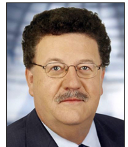
Hans-Joachim Fuchtel WK Calw

Unsere Landesgruppe wird im Bundeskabinett wieder prominent mit Frau Prof. Dr. Annette Schavan MdB als Bundesministerin für Bildung und Forschung und Herrn Dr. Wolfgang Schäuble MdB jetzt als Bundesminister der Finanzen vertreten sein. Hinzu kommen in der neuen Wahlperiode Frau Annette Widmann-Mauz MdB als Parlamentarische Staatssekretärin beim Bundesminister für Gesundheit und Hans-Joachim Fuchtel MdB als Parlamentarischer Staatssekretär beim Bundesminister für Arbeit und Soziales.