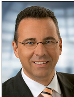
Dr. Joachim Pfeiffer

In der vorherigen Sitzungswoche des Deutschen Bundestages hatte die CDU/CSU-Bundestagsfraktion bereits zu Vorsitzenden der Arbeitsgruppen gewählt: Für den Bereich Wirtschaft und Technologie Dr. Joachim Pfeiffer MdB, für den Haushalt Norbert Barthle MdB, für Verteidigung Ernst-Reinhard Beck MdB, für Sport Klaus Riegert MdB.