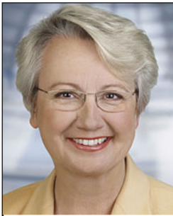
Prof. Dr. Annette Schavan WK Ulm

Bundesministerin für Bildung und Forschung