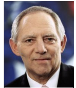
Dr. Wolfgang Schäuble WK Offenburg

Nach sehr zügigen Koalitionsverhandlungen zwischen CDU/CSU und FDP und der Bestätigung des aus den Koalitionsverhandlungen resultierenden Koalitionsvertrages durch die jeweiligen Parteitage von CDU, CSU und FDP fand einen Tag nach der Konstituierung des Deutschen Bundestages am 27. Oktober 2009 die Wahl der Bundeskanzlerin Dr. Angela Merkel MdB sowie die Vereidigung des Bundeskabinetts im Deutschen Bundestag statt.