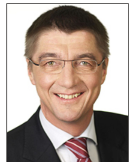
Dr. Andreas Schockenhoff WK Ravensburg

Im weiteren Verfahren der Besetzung von Positionen in der Fraktionsführung wurde unser Landesgruppenkollege Dr. Andreas Schockenhoff von der CDU/CSU-Bundestagsfraktion erneut zum stellvertretenden Fraktionsvorsitzenden für die Politikbereiche Außen, Verteidigung und Europa gewählt.