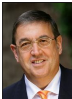
Dr. Karl A. Lamers

Vorsitzender Ausschuss für Angelegenheiten der Europäischen Union