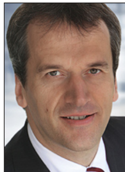
Michael Hennrich WK Nürtingen